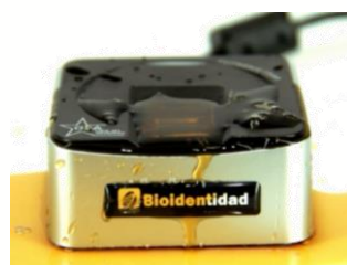
Sensor dactilar protegido contra derrames de líquidos e ingreso de polvo