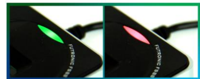
LED multicolor indica el estado y resultado del proceso