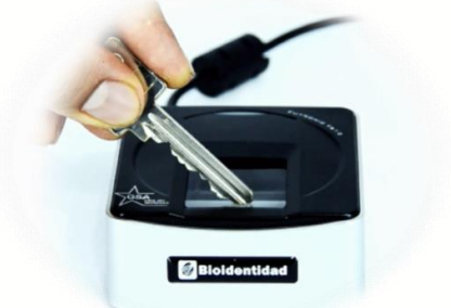
Sensor dactilar en vidrio grueso altamente resistente a ralladuras y abrasión

La impresión dactilar obtenida es de tan buena calidad, que inclusive pueden apreciarse los poros ubicados en las crestas dactilares.