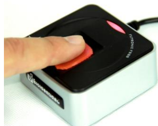
Detección de dedo vivo avanzada detecta y rechaza materiales artificiales